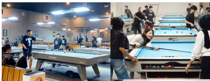
Gambar 3. Interaksi antar Pemain Billiard

Sementara itu, di Unit Kegiatan Mahasiswa (UKM) Billiard Sport FIK UNP, terlihat adanya kegiatan latihan mingguan yang tidak hanya diisi dengan permainan, tetapi juga diskusi ringan dan pembelajaran teknik antar anggota. Mahasiswa terlihat sedang bermain billiard dan menjadikan kegiatan ini sebagai ruang untuk menjalin pertemanan, bertukar pengalaman, dan memperkuat relasi sosial antar anggota lintas angkatan. Observasi ini menunjukkan bahwa aktivitas bermain billiard memang kerap menjadi sarana untuk menjalin dan mempererat hubungan sosial antar individu.