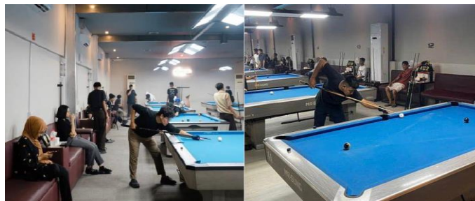
Gambar 2. Postur Tubuh dalam Bermain Billiard

Berdasarkan hasil wawancara dari beberapa informan, dapat disimpulkan bahwa yang ketertarikan individu terhadap billiard karena memiliki pandangan bahwa billiard sebagai cabang olahraga yang memerlukan konsentrasi, keterampilan teknik, dan kemampuan fisik. Hal ini sesuai dengan hasil observasi beberapa pemain di Basecamp Billiard terlihat fokus dalam mengatur strategi sebelum memukul bola, seperti memilih bola tertentu untuk dimasukkan, mengatur posisi bola untuk pukulan berikutnya dan bergerak mengelilingi meja untuk menentukan sudut pukulan.