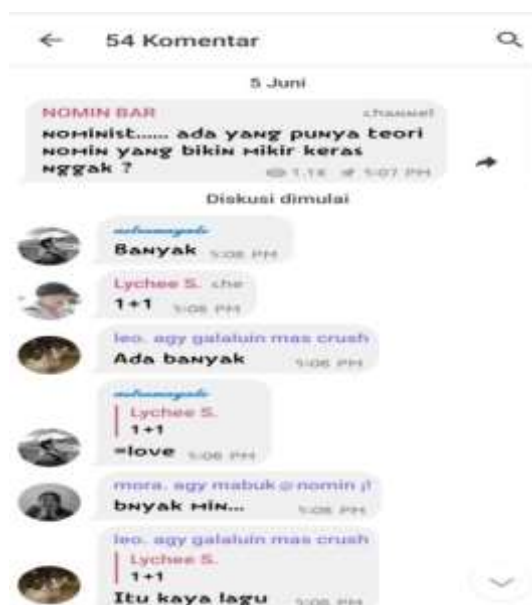
Gambar 3. Percakapan dalam Grup Nomin Shiper

Foto kedua . Pada foto di bawah ini menampilkan percakapan anggota grup Nomin Shiper pada 5 Juni 2021 ini menunjukkan ketika salah satu admin grup Nomin Shiper bertanya pada anggota grup tentang teori yang berkaitan dengan Nomin .