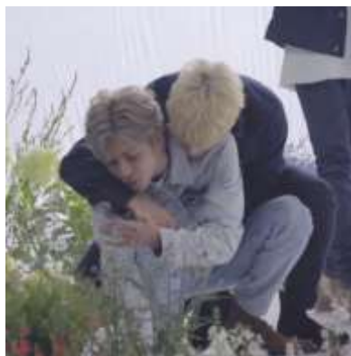
Gambar 1. Jeno sedang Memeluk Jaemin

tentang semiotika tanda untuk memaknai makna di balik kegiatan yang ada dalam grup tersebut. Penelitian ini juga bertujuan untuk mencari tahu makna dibalik foto yang dilihat berbeda oleh anggota grup dibanding penggemar biasa. Dimana anggota dalam grup Nomin Shiper ini melihat Jeno dan Jaemin sebagai sepasang kekasih dan berpikiran kotor tentang itu dengan menikmati konten yaoi , padahal bagi penggemar Jeno dan Jaemin yang lain tak memiliki pemikiran serupa, mereka tetap menganggap Jeno dan Jaemin sebagai sahabat.