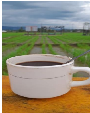
Gambar 4. Secangkir kopi yang dinikmati pengunjung

Berikut gambaran seseorang pengunjung yang menikmati suasana Kafe Kopi Darat pada sore hari: