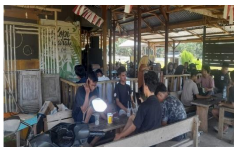
Gambar 5. Aktivitas bermain game di Kafe Kopi Darat

Berikut aktivitas bermain game di Kafe Kopi Darat: