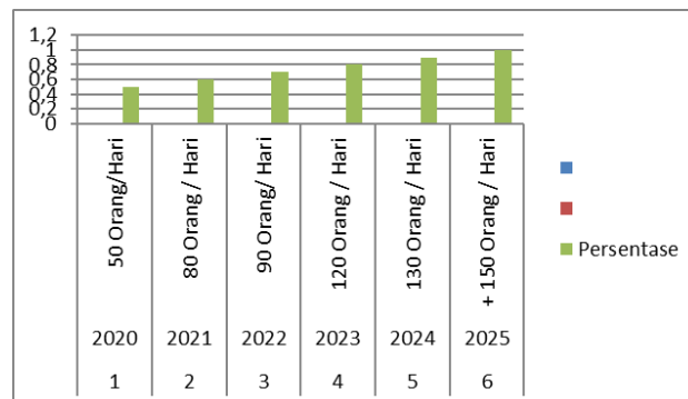
Gambar 2. Intensitas kunjungan ke Kafe Kopi Darat selama 6 tahun terakhir