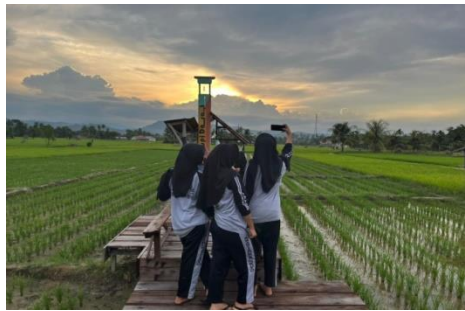
Gambar 3. Aktivitas berfoto remaja Gen Z di Kafe Kopi Darat

disimpulkan bahwa, remaja Gen Z ketika mengunjungi kafe menjadikan foto sebagai bagian dalam aktivitas yang mereka lakukan, yang tentunya memiliki makna bagi mereka. Berikut aktivitas berswafoto yang dilakukan oleh remaja Gen Z di Kafe Kopi Darat: